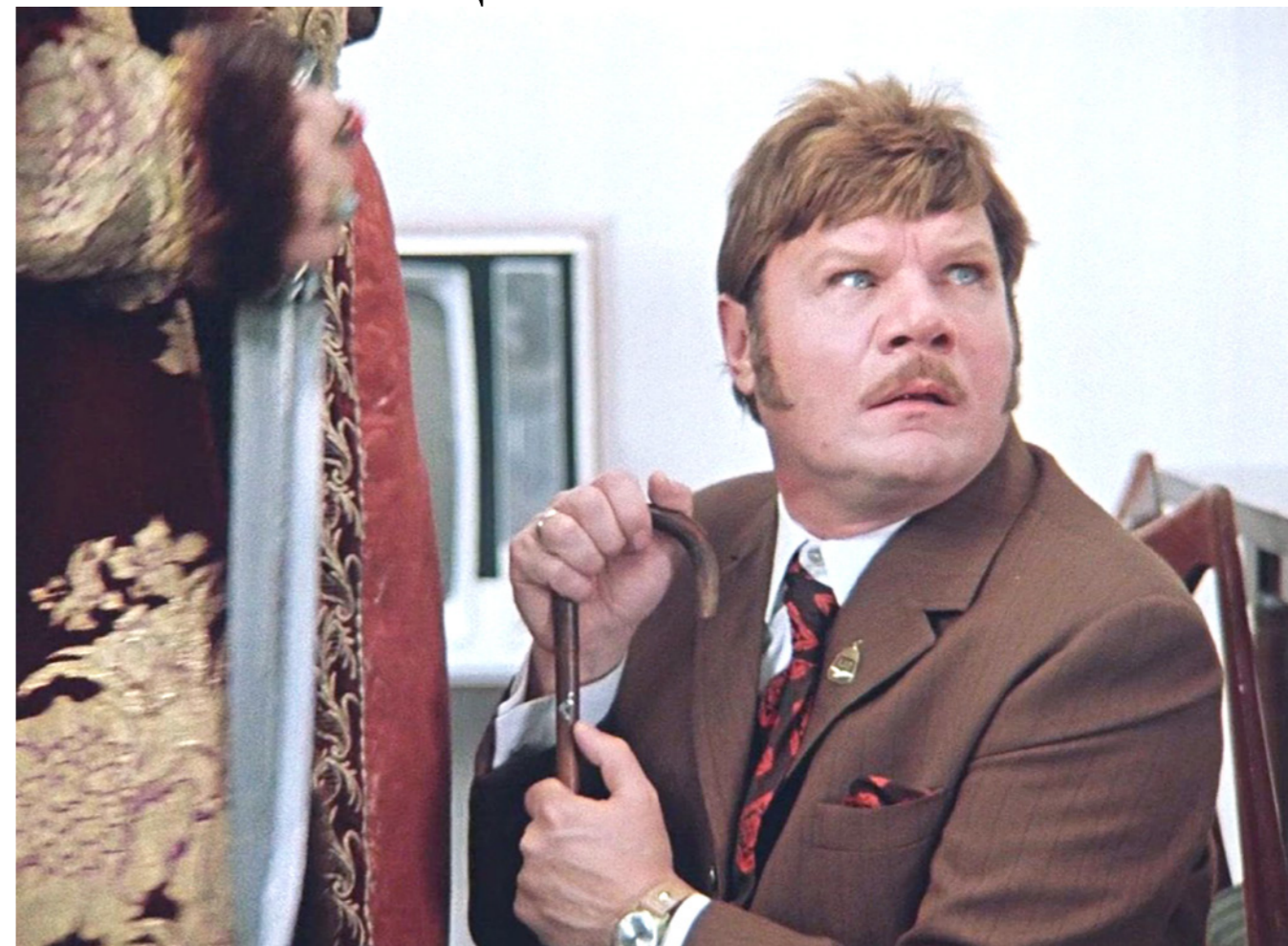
Сцена из фильма «Иван Васильевич меняет профессию»

«Паки, паки... Иже херувимы!» – произносит герой фильма «Иван Васильевич, меняет профессию» режиссер Якин, лихорадочно вспоминая славянские слова, увидев перед собой царя Ивана Грозного. Мало кто знает, что автор пьесы Михаил Афанасьевич Булгаков был сыном священника, а потому многие детали церковной жизни были ему хорошо знакомы. Видимо поэтому он вложил в уста своего героя одно из самых известных, наверное, церковнославянских слов – «паки». У современного человека «паки» не ассоциируется ни с одним из русских слов. Для его понимания необходимо просто запомнить его перевод. А он таков. По-русски слово «паки» означает «снова» или «вновь».