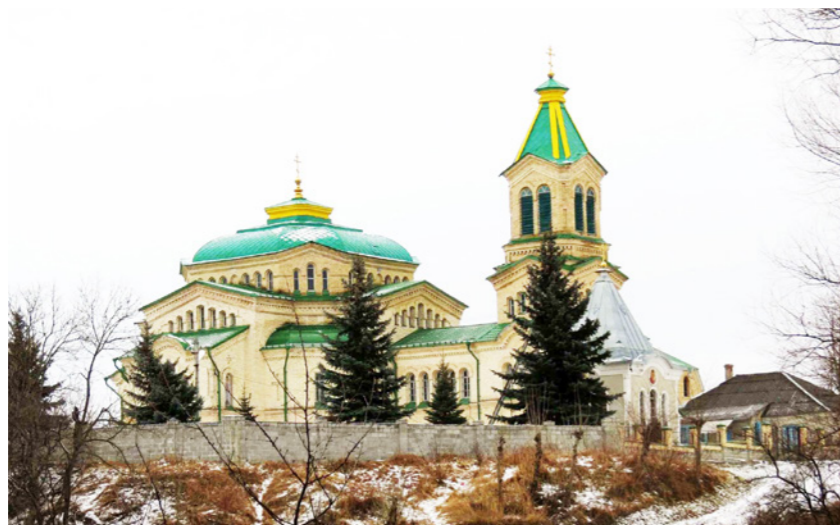
Храм Святителя Николая Чудотворца в станции Зольской

6 мая - Праздник Св. Георгия на горе Шоан. Архиерейское богослужение в древнем храме св. вмчч. Георгия Победоносца