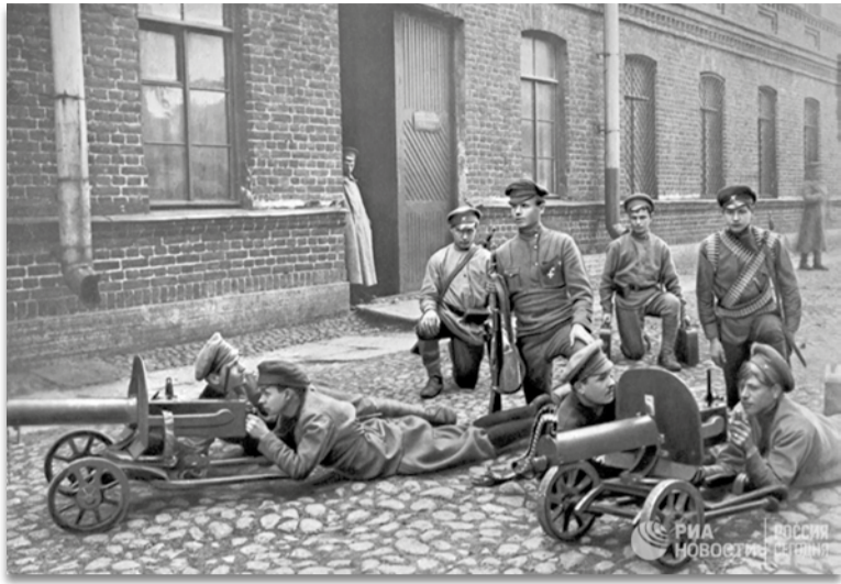
(Окончание. Начало на стр. 3)

К Зимнему дворцу накануне большевистского переворота были собраны разрозненные подразделения из юнкеров Ораниенбаумской и Петергофской школ прапорщиков, Инженерной школы, рота женского ударного батальона, несколько десятков гарнизонных офицеров и калек-«георгиевцев».