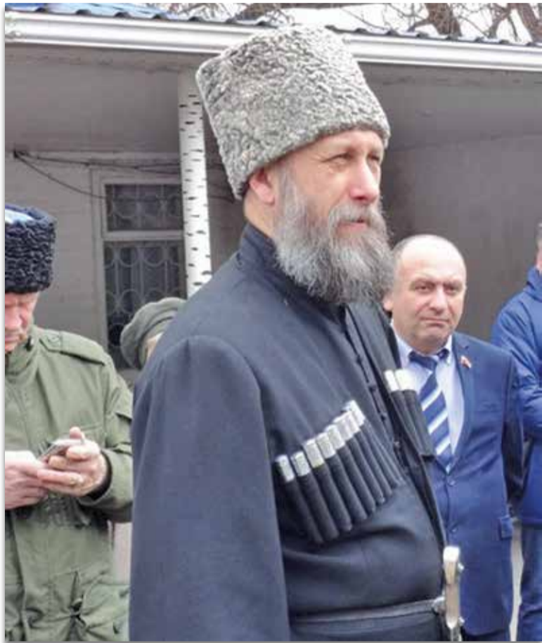
(Фрагменты из статьи)

23 февраля этого года страна отмечала столетие со дня создания Российской армии. Было бы логичным проведение широкомасштабных торжеств, посвященных такому знаменательному юбилею, но комплекс мероприятий как на федеральном уровне, так и на местных, ничем не выделялся от тех, которые проводились в предыдущие годы. Складывается впечатление, что кого-то уже не устраивает идеологическое наполнение праздника, оставшееся в некоторой мере от предыдущей эпохи, и историческая платформа, на которой 23 февраля основывается. В то же время переносить или отменить праздник власть предрержащие не торопятся.