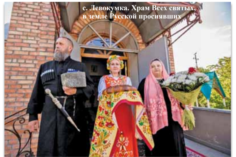
с. Лвокумка. Храм Всех святых, в земле Русской просиявших

10 июня, в Неделю Всех святых в земле Русской просиявших, архиепископ Пятигорский и Черкесский Феофилакт со-