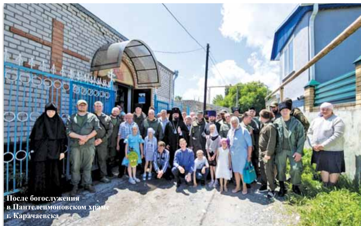
После богослужения в Пантелеимоновском храме г. Карачаевска

совпал с праздником Владимирской иконы Божией Матери. Казачество с самого начала своего возрождения оказывает приходу всестороннюю помощь.