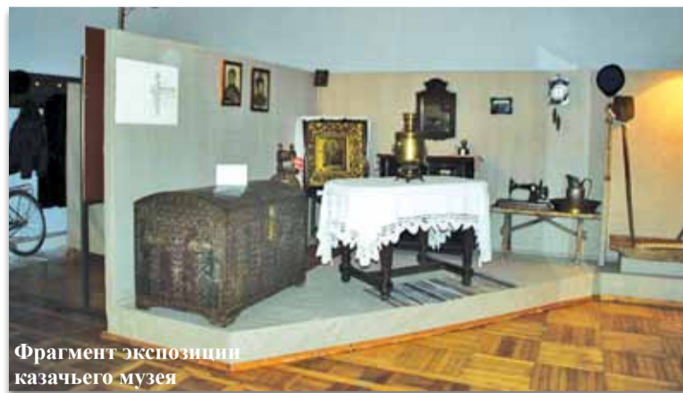
Фрагмент экспозиции казачьего музея