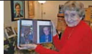
Реликвия для терских казаков