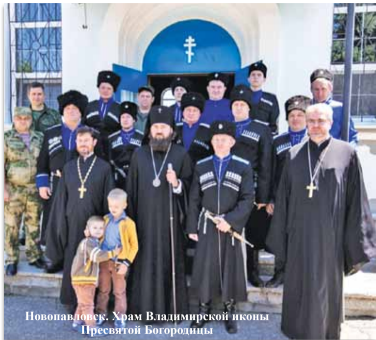
Новопавловск. Храм Владимирской иконы Пресвятой Богородицы

«Я радуюсь тому, что молюсь вместе с казаками» – своих собратьев потомственный терский казак архиепископ Пятигорский и Черкесский Феофилакт приветствует особо, если на богослужении видит людей в казачьей форме. Во всех храмах, где в последнее время побывал владыка, казаки проявили интерес к богослужению и были рады общению с архипастырем, возможности обсудить с ним свои насущные дела, получить благословение на свою деятельность.