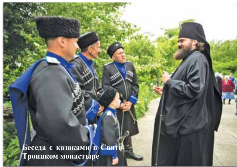
Беседа с казаками в Свято-Троицком монастыре

29 мая, в день Святого Духа, архиепископ Пятигорский и Черкесский Феофилакт совершил Божественную литургию в Свято-Троицком Серафимовском женском монастыре в селе