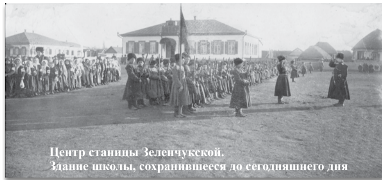
Центр станицы Зеленчукской. Здание школы, сохранившееся до сегодняшнего дня