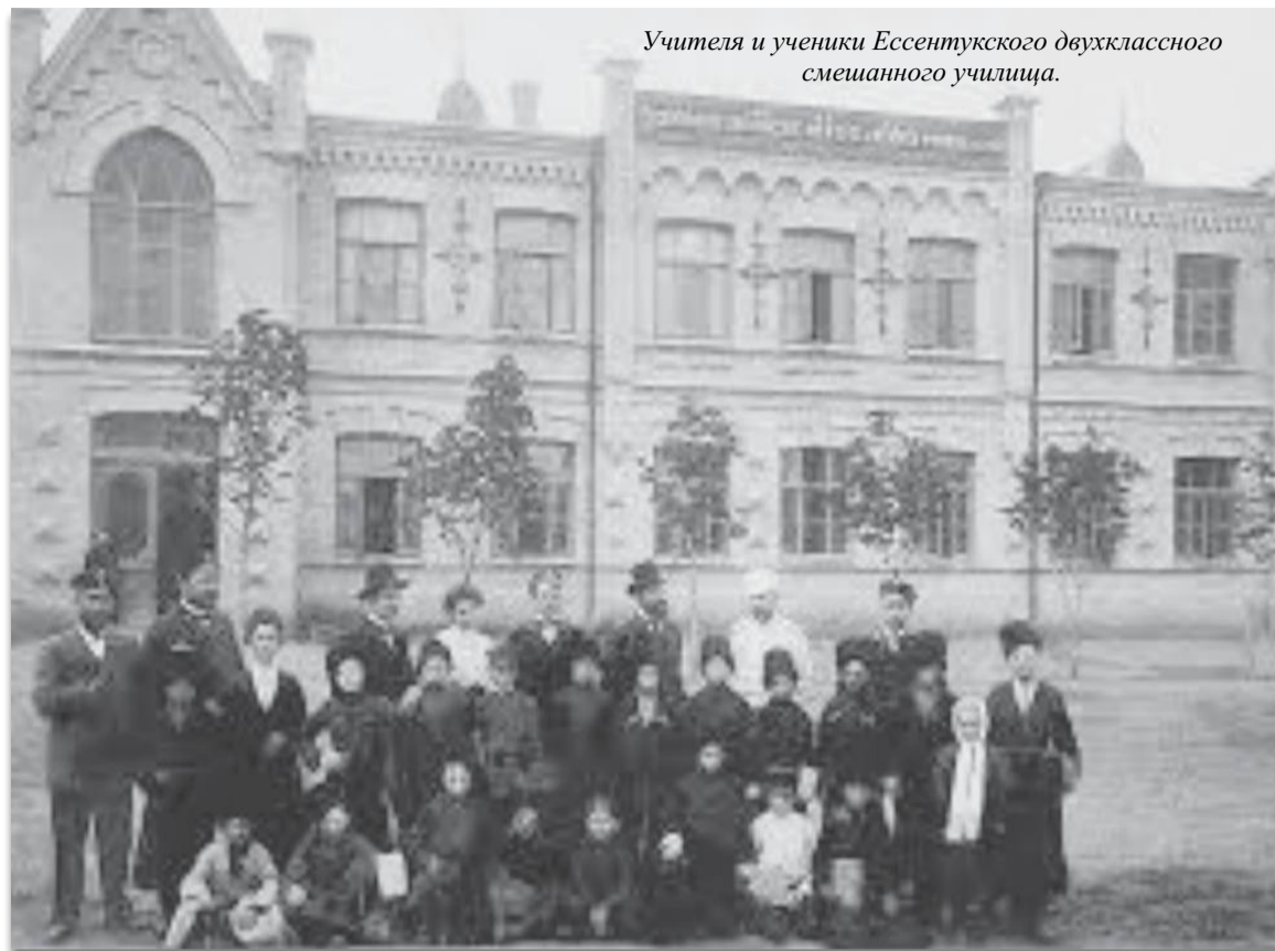
Учителя и ученики Эссентукского двухклассного смешанного училища.

Еще одним знаковым событием для юных казаков нашей школы стали ежегодные поездки в июле в город Серафимович (Волгоградская область) в Усть-Медведицкий Спасо-Преображенский женский монастырь. Ребята нашей школы принимали активное участие в восстановлении храма, оказывая посильную помощь.