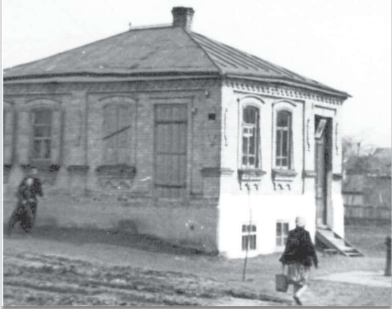
Здание Галашинской школы.

Обязанности, взятые на себя казачеством, обширны и сложны. Их реализация требует специальных знаний, возрождения забытых традиций и методик подготовки к воинской службе, патриотического воспитания. В этих условиях обращение к истории становления школьного образования и военной подготовки, накопленному казачеством опыту является делом первоочередным и крайне необходимым.