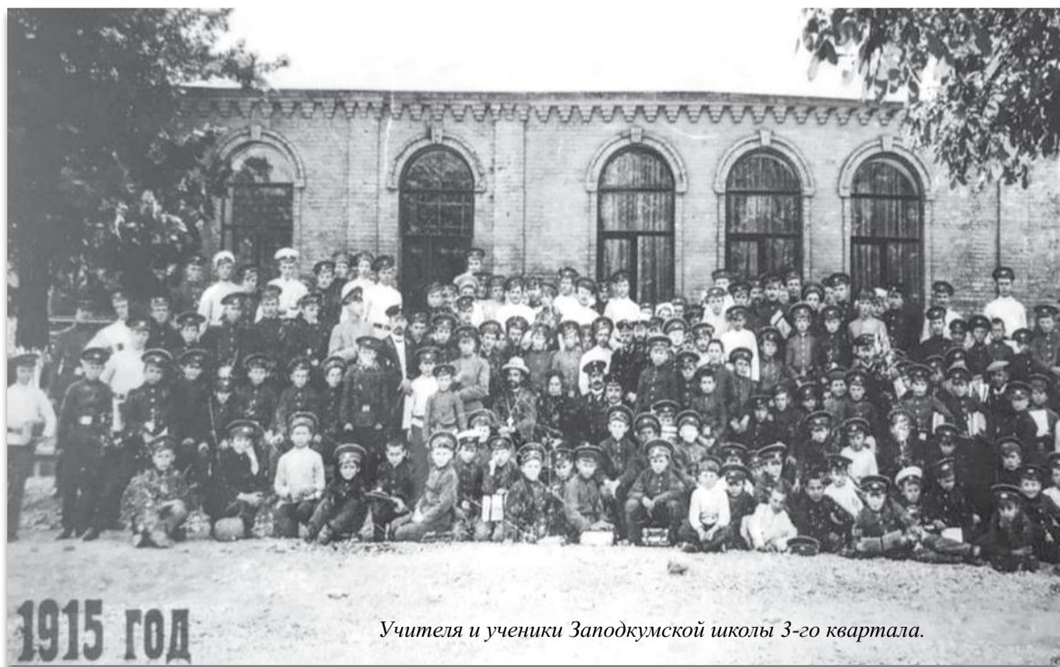
Учителя и ученики Заподкумской школы 3-го квартала.

Педагогами школы была разработана технология воспитания личности гражданина средствами традиционной казачьей культуры в условиях общеобразовательной школы. В учебный план были введены предметы: спецкурс «История кадетских корпусов», «История казачества», «Огневая подготовка», «Строевая подготовка». Разработаны и утверждены дополнительные образовательные программы: спортивные бальные танцы, хореографический кружок народного танца, декоративно-прикладное искусство, музейное дело, пешеходный туризм, духовно-нравственные и музыкально-эстетические основы культуры казачества. Кроме того, практически на всех уроках проводятся занятия, связанные с историей казачества и его развитием в современности. Так, на уроках физической культуры проводятся казачьи игры. Такие, как «Крест на крест», «Бой петухов», «Казачьи бои», «Казачата, смирно», «Точный расчет», «Челнок», «Чехарда» и другие. На уроках технологии юные казачки учатся готовить по рецептам своих матерей и бабушек. На уроках изобразительного искусства кадеты изучают темы «Казачество в русском изобразительном искусстве», «Казачья одежда», «Казачья усадьба». На уроках музыки разучиваются казачьи песни, ко-